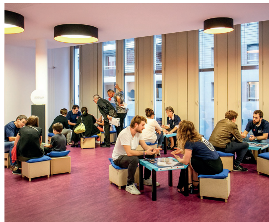
© Denis Chaussende - le scientific-dating, Nuit des chercheur.e.s, Université de Lyon

Le Rize, établissement culturel municipal de Villeurbanne, est doté d'un pôle de recherche accueillant en résidence de jeunes chercheur.e.s dont les travaux scientifiques portent sur la ville de Villeurbanne et l'agglomération lyonnaise, les migrations du XX ème siècle, les cultures ouvrières et les mémoires contemporaines.